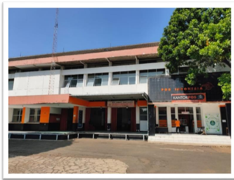
Gambar 1. 1 Tampak Depan Perusahaan

Kantor Mail Processing Center (MPC) merupakan kantor pos utama dalam melakukan proses pengiriman barang. Kantor MPC juga ditempatkan satu kantor dalam satu provinsi. Kantor MPC yang berada di Bandung menaungi alur pengiriman barang dari kantor pos di wilayah Jawa Barat.