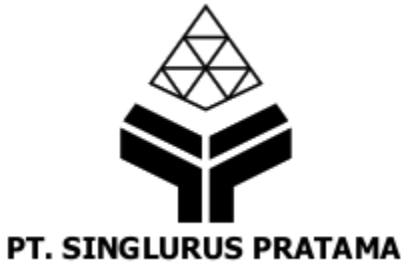
Gambar 1. 1 Logo PT. SINGLURUS PRATAMA

Produk yang dihasilkan oleh PT. SINGLURUS PRATAMA adalah batu bara. Batu bara itu sendiri adalah batuan yang dapat terbakar, terbentuk dari endapan organik seperti sisa-sisa tumbuhan dan terbentuk melalui proses pembatubaraan. Unsur dari batu bara itu sendiri utamanya terdiri dari karbon, hydrogen, nitrogen dan oksigen. Batubara juga batuan yang memiliki sifat kimia dan fisika yang kompleks yang dapat di temui dalam berbagai bentuk. Bahan pembentuk batu bara berasal dari tumbuhan. Berdasarkan tingkat proses pembentukannya yang di control oleh tekanan, panas, dan waktu, batu bara di bagi dalam lima kelas, yaitu : antrasit, bituminus, sub-bituminus, lignit, dan gambut.