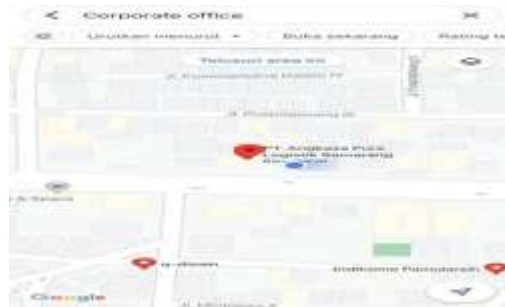
Gambar 1. 3 Lokasi Perusahaan

Jl. Pamularsih Raya No. 99a, Gisikdrono, kec. Semarang Barat, kota Semarang Jawa Tengah 50149.