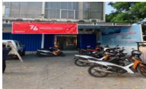
Gambar 1. 4 Tampak Depan Perusahaan