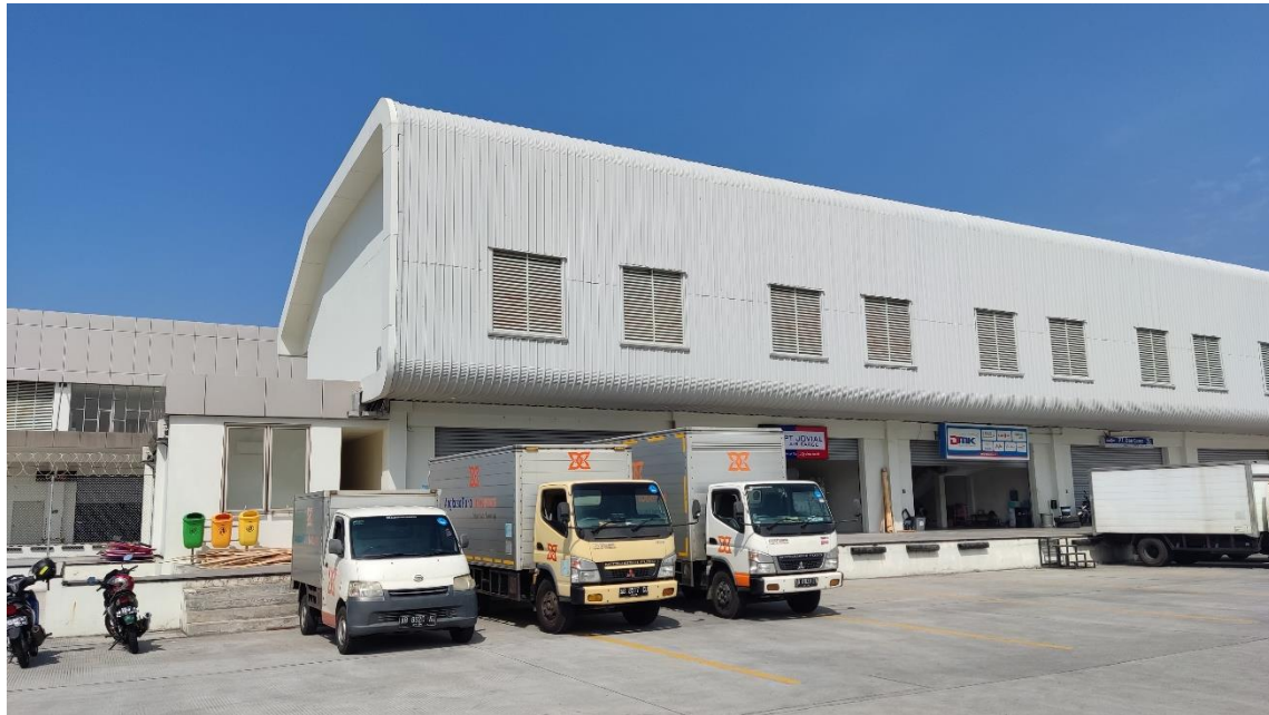
Gambar 1. 4 EMPU Angkasa Pura Logistic