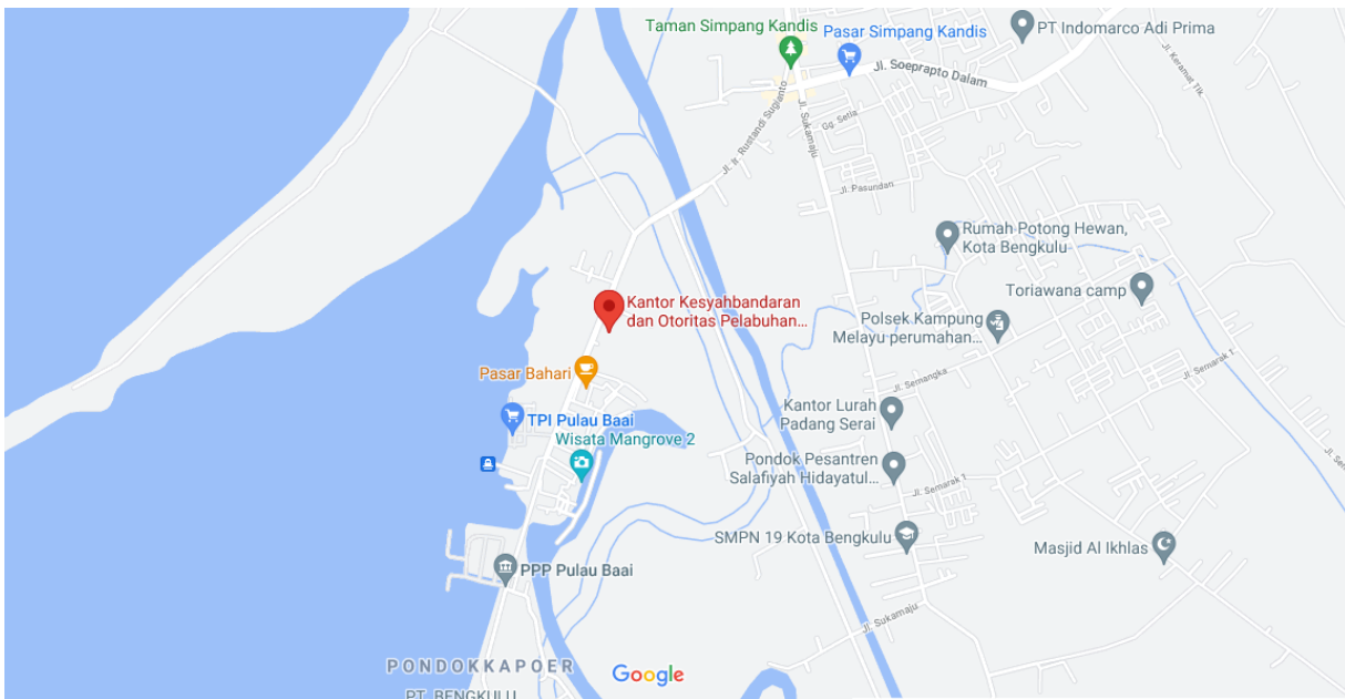
Gambar 1. 3. Lokasi Perusahaan Dilihat Dari Google Maps

Lokasi Perusahaan Kantor Kesyahbandaran dan Otoritas Pelabuhan Kelas III Pulau Baai Bengkulu terletak di Jl. Ir. Rustandi Sugianto Pulau Baai, Kampung Melayu, Sumber Jaya, Kampung Melayu, Kota Bengkulu, Bengkulu. Jika dilihat pada peta maka akan seperti gambar dibawah ini :