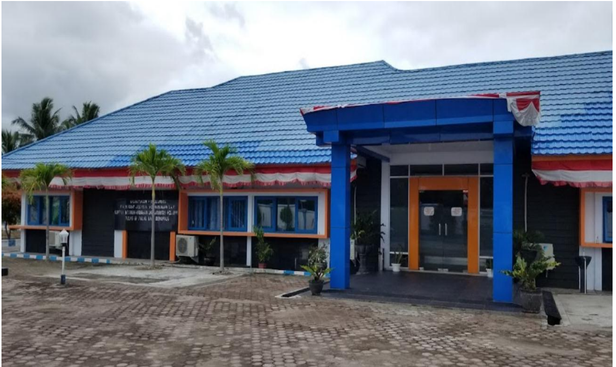
Gambar 1. 1. Kantor Kesyahbandaran dan Otoritas Pelabuhan Kelas III Pulau Baai Bengkulu

Kantor Kesyahbandaraan dan Otoritas Pelabuhan Pulau Baai Bengkulu adalah unit pelaksana teknis di lingkungan Kementerian Perhubungan yang berada dibawah dan bertanggung jawab kepada Direktur Jenderal Perhubungan Laut. Kantor Kesyahbandaran dan Otoritas Pelabuhan Pulau Baai Bengkulu di pimpin oleh seorang Kepala Kantor.