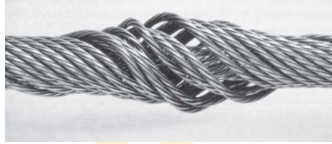
Gambar 1. 2 Contoh kerusakan pada material wire rope

Pada penelitian ini masalah yang terjadi dalam proses pengadaan material wire rope yang akan digunakan untuk komponen pada RTG, dimana bagian material ini sangat penting sekali karena komponen ini yang akan menjadi titik beban untuk mengangkat container . Dalam pengadaan material wire rope ini mengalami masalah karena bagian purchasing hanya mengandalkan pada kriteria harga saja tidak membandingkan dengan kriteria yang lain seperti kriteria kualitas, pengiriman dan lain-lain yang mengakibatkan salah memilih supplier . Supplier yang terpilih tidak dapat mengadakan material sesuai dengan spesifikasi material yang diinginkan oleh pihak perusahaan serta dalam proses pengirimannya terlambat akhirnya dapat mengganggu proses kegiatan bongkar muat container di PT. JICT.