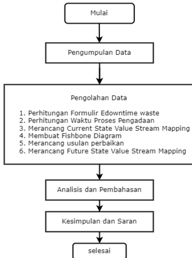
Gambar 3.2 Rancangan Analisis Data