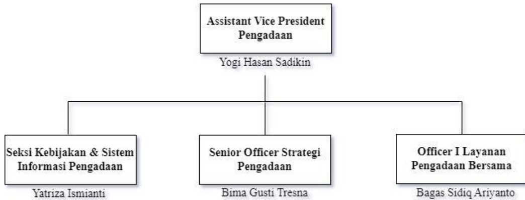
Tabel III. 1 Struktur Organisasi