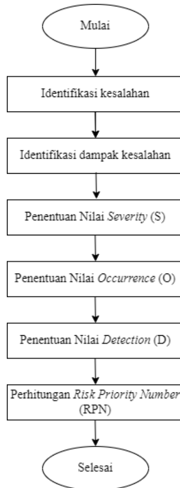
Gambar 3.2. Rancangan Analisis

rancangan analisis penelitian sesuai dengan metode atau teknik yang digunakan dalam penelitian. Berikut adalah langkah-langkah metode yang digunakan dapat dilihat pada gambar 3.2: