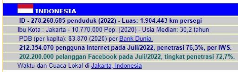
Gambar 1. 2 Penggguna Internet di Indonesia

Pada Gambar 1.1, terjadi peningkatan nilai pertumbuhan B2B e-commerce di Indonesia yaitu mengalami pertumbuhan dari periode 2018-2022, pertumbuhan setiap tahunnya mengalami peningkatan mencapai tingkat 25%.