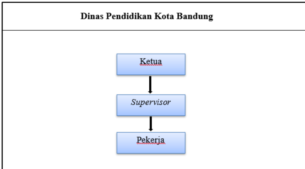
Gambar I.2 Struktur Organisasi Proyek Pembangunan Toilet

Berdasarkan gambar di atas tugas dan tanggung jawab Tim Pelaksanaan Kegiatan Pembangunan Toilet SDN Sarijadi 218 Tahun 2023: