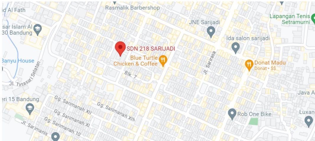
Gambar I.1 Lokasi Proyek

Lokasi proyek berada di Jl. Sarimanah No. 19, RT. 10 / RW. 01, Sarijadi, Kec. Sukasari, Kota Bandung, Jawa Barat 40164