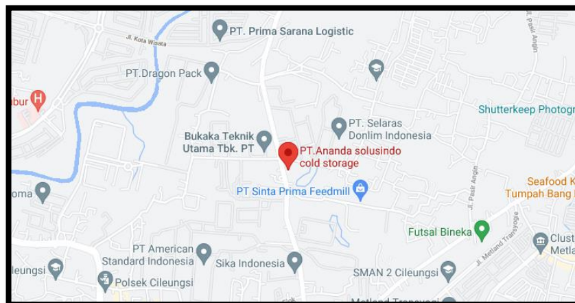
Gambar 1.3 Lokasi Perusahaan PT Ananda Solusindo Cold Storage

Alamat : Jl. Raya Narogong No.77, Pasir Angin Kecamatan Cileungsi Kota : Bogor Provinsi : Jawa Barat Kode Pos : 16820 Telepon : +62 21 8249 0397