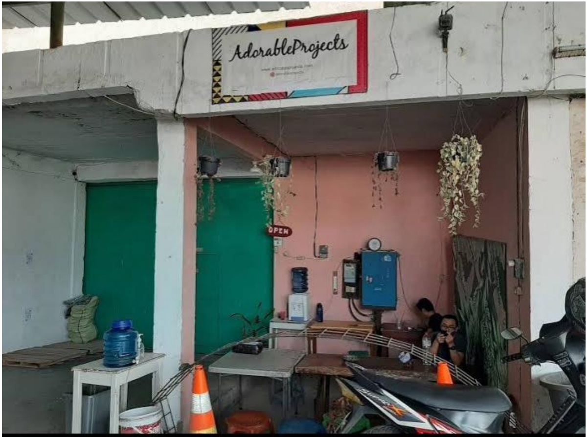
Gambar 1.1 Profil Adorable Projects