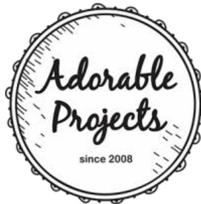
Gambar 1. 1 Adorable Projects