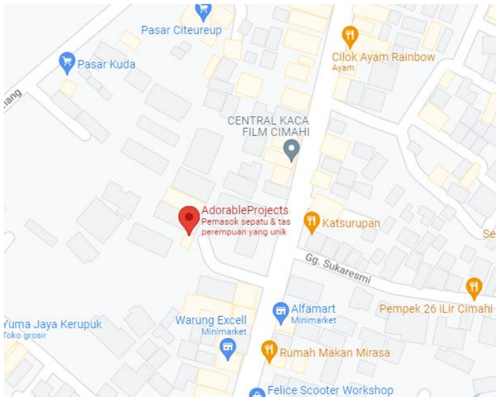
Gambar 1. 3 Lokasi Gudang Adorable Project

Adorable Project Cimahi memiliki 2 lokasi, lokasi pertama yaitu tempat gudang dan toko yang beralamat di Jl. Kolonel Masturi No.163a, Cipageran, Kec. Cimahi Utara, Kota Cimahi, Jawa Barat 40523 ditunjukkan pada gambar 1.3. Lokasi kedua yaitu kantor yang beralamat di Perum Bumi Indah No.75 - 76, Cibereum, Kec. Cimahi Sel., Kota Cimahi, Jawa Barat 40535.