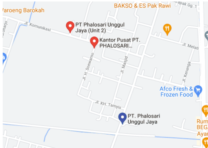
Gambar 1.3 Letak Kantor berdasarkan Google Maps

PT Phalosari Unggul Jaya berlokasi di Jl. Mojokrapal 1A, Mojokrapak, Jombang, Jawa Timur. Berikut adalah lokasi perusahaan dilihat dari google maps :