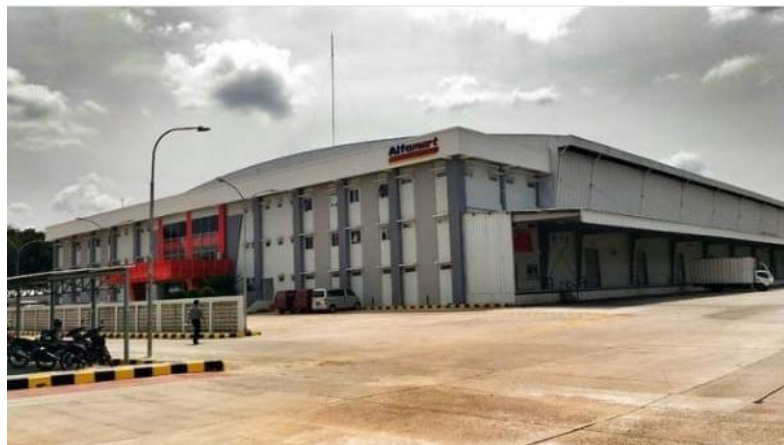
Gambar 1. 3 Lokasi Perusahaan