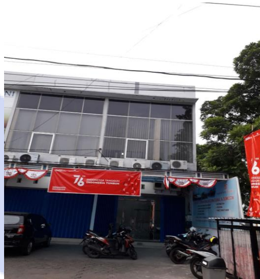
Gambar 1. 3 Lokasi PT Angkasa Pura Logistik Cabang Semarang

PT Angkasa Pura Logistik (APLog) Cabang Semarang berada di Jalan Pamularsih Raya No 99 Kota Semarang, Jawa Tengah.