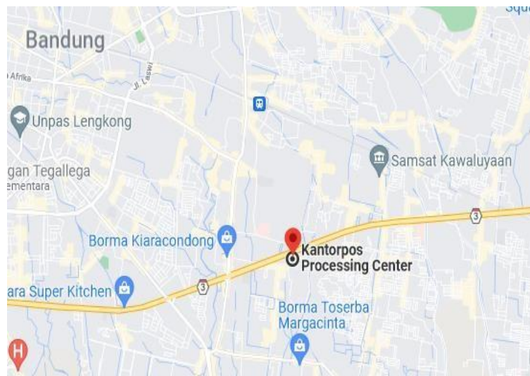
GAMBAR 1. 2 Lokasi PT. POS MPC Indonesia

Lokasi Kantor Pos MPC ( Mail Processing Center ) Bandung tempat saya Kuliah Praktik (KP) / Magang terletak di jalan Soekarno-Hatta No 558, Sekejati, Kec. Buahbatu, Kota Bandung, Jawa Barat 40286.