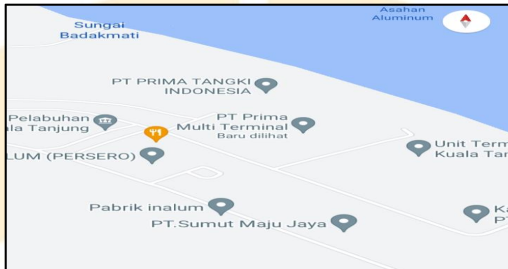
Gambar 1. 3 Lokasi PT Prima Multi Terminal