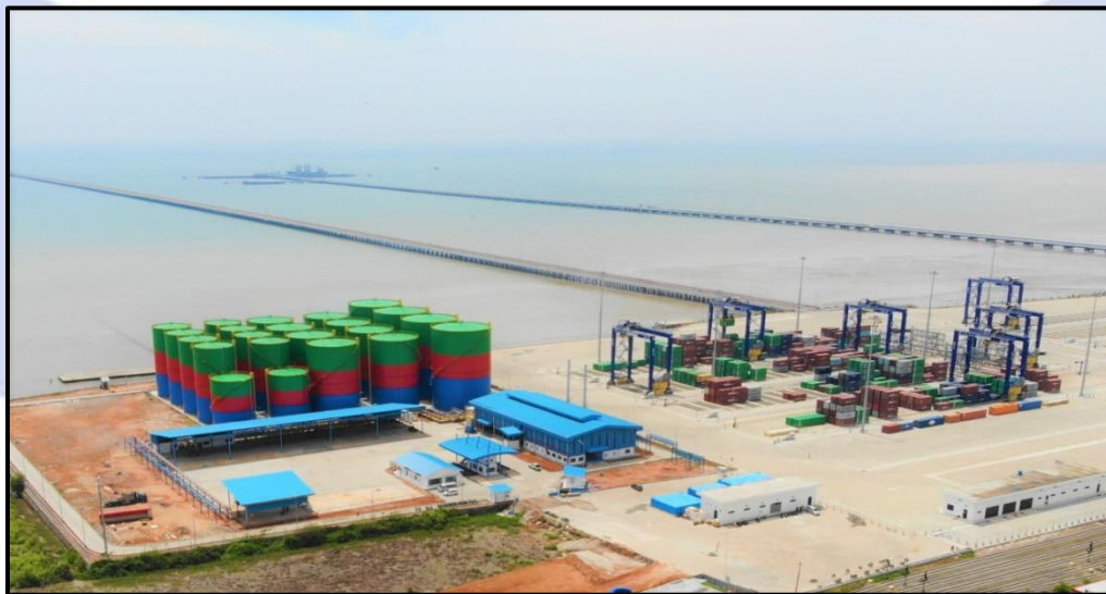
Gambar 1. 4 Lokasi Dermaga PT Prima Multi Terminal