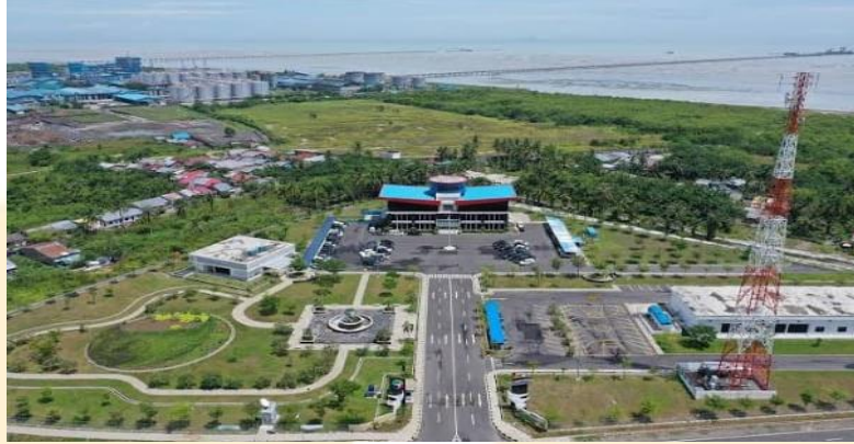
Gambar 1. 1 Gedung Main Office PT Prima Multi Terminal

PT Prima Multi Terminal adalah perusahaan yang bergerak di bidang usaha Pelayanan Jasa kepelabuhanan. PT Prima Multi Terminal sebagai pendukung utama Transportasi laut yang secara langsung maupun tidak langsung berperan aktif dalam pembangunan ekonomi Provinsi Sumatera Utara. Bidang Usaha PT Prima Multi Terminal adalah menyediakan dan mengusahakan jasa kepelabuhanan untuk menunjang kelancaran angkutan laut dalam rangka menunjang pelaksanaan pembangunan nasional, sesuai dengan Keputusan Menteri (Kepmen) Perhubungan dalam rangka memenuhi pelayanan jasa petikemas yang merupakan salah satu bentuk pelayanan yang disediakan oleh PT Prima Multi Terminal sehingga perlu untuk menciptakan standar pelayanan peti kemas yang berorientasi pada kepuasan pelanggan.