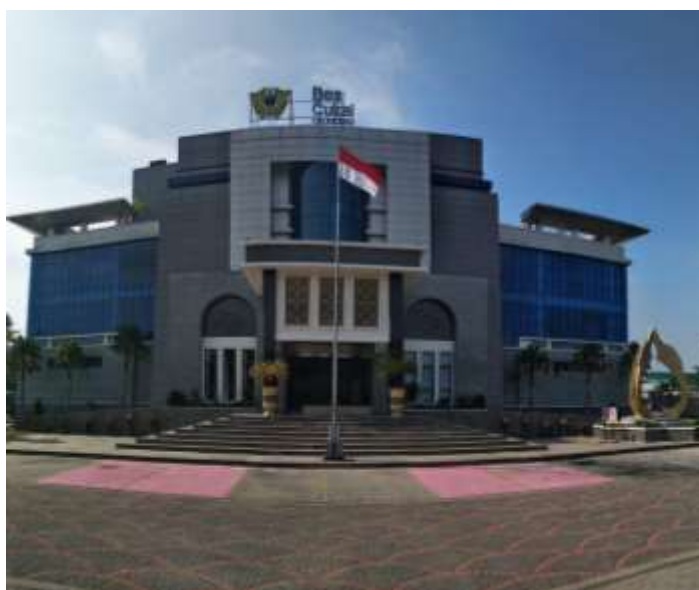
Gambar 1.1 : Gedung Perusahaan

Kantor Pengawasan dan Pelayanan Bea dan Cukai Tipe Madya Cikarang adalah Kantor Pengawasan dan Pelayanan Bea dan Cukai dibawah Direktorat Jenderal Bea dan Cukai Kementerian Keuangan Republik Indonesia. Didirikannya kantor KPPBC TMP Cikarang ini juga merupakan sebuah bukti dukungan DJBC terhadap dunia industri demi memperlancar perdagangan , maka keberadaan Kantor Bea Cukai Cikarang sangat dibutuhkan karena berada di kawasan pusat industri. Dalam Melaksanakan Tugasnya wilayah Kerja KPPBC TMP Cikarang Meliputi Kabupaten Bekasi disebelah utara jalan tol , kecuali kecamatan cikarang barat , Tambun selatan , dan Cibitung , serta fokus pengawasan KPPBC TMP Cikarang meliputi pengawasan terhadap KPPT - CDP ( Cikarang Dry Port ) , Perusahaan Tempat Penimbunan Berikat (TPB) serta NPPBKC dan peredaran barang Kena Cukai. KPPBC TMP Cikarang dalam menjalankan tugas dan fungsinya di dukung oleh Seksi Pelayanan Kepabaeanan dan Cukai (PKC) , Seksi Perbendaharaan , Seksi Penindakan dan Penyidikan , Seksi Kepatuhan Internal , Seksi Penyuluhan dan Layanan Informasi , Seksi Manifes , Subbagian Umum , Seksi Pengelolaan data dan Administrasi Dokumen , Seksi Kepatuhan Internal , dan Pejabat Fungsional Pemeriksa Dokumen.