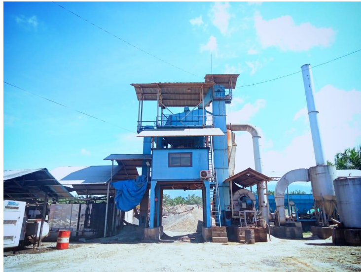
Gambar 1. 1 Profil PT Aura Mandiri Sejahtera

PT Aura Mandiri Sejahtera merupakan perusahaan yang bergerak dalam bidang pertambangan dengan jenis usaha Asphalt Mixing Plan (AMP) dan Stone Crusher .