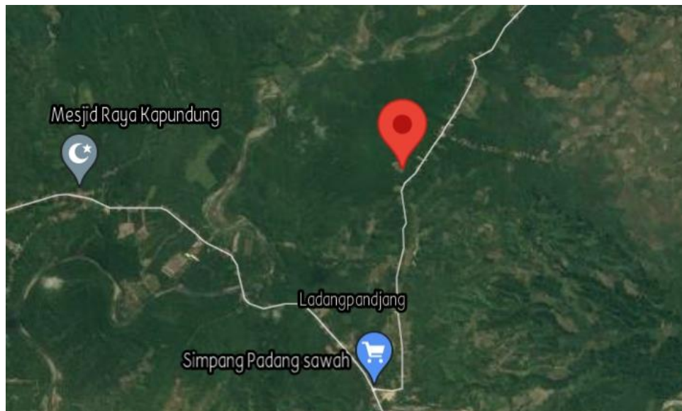
Gambar 1. 3 Peta Lokasi PT Aura Mandri Sejahtera

Gambar di bawah ini merupakan gambar peta lokasi PT Aura Mandiri Sejahtera